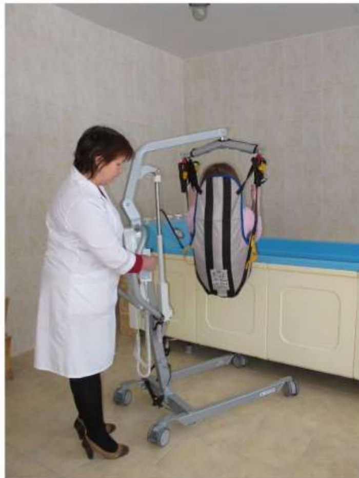
Устройство для подъёма и перемещения маломобильной категории инвалидов (подъёмник).